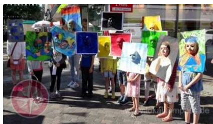
Kreativclub crass & klever